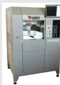
Plotter SP 05/GSV