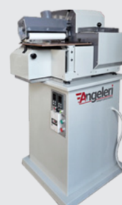
Termoencoladora TH 82/300