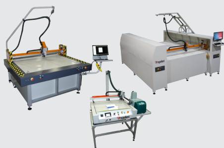
Plotter SP07/GP Series